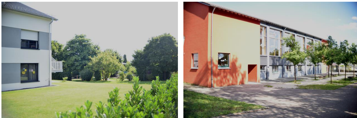
Abb. 6 u. 7: Bereiche des Bebauungsplans, die keine Veränderung erfahren: Seniorenwohnheim mit Spielplatz im Hintergrund (rechts) und die Gemeindehalle von Westen her betrachtet (links).