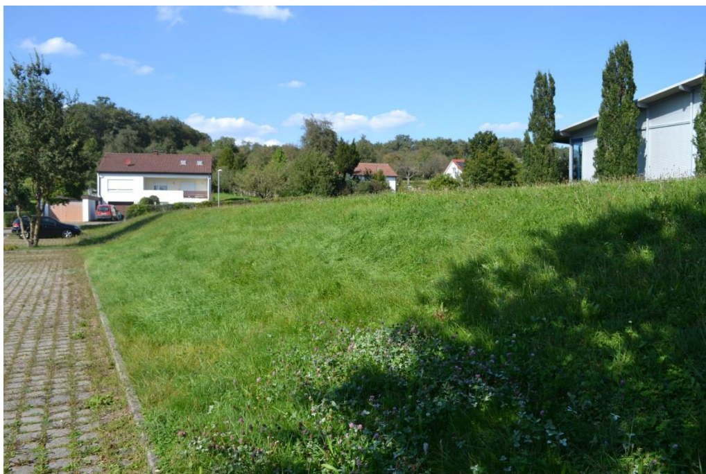
Abb. 5: Böschung im Westen der Fläche angrenzend an den bestehenden Parkplatz.