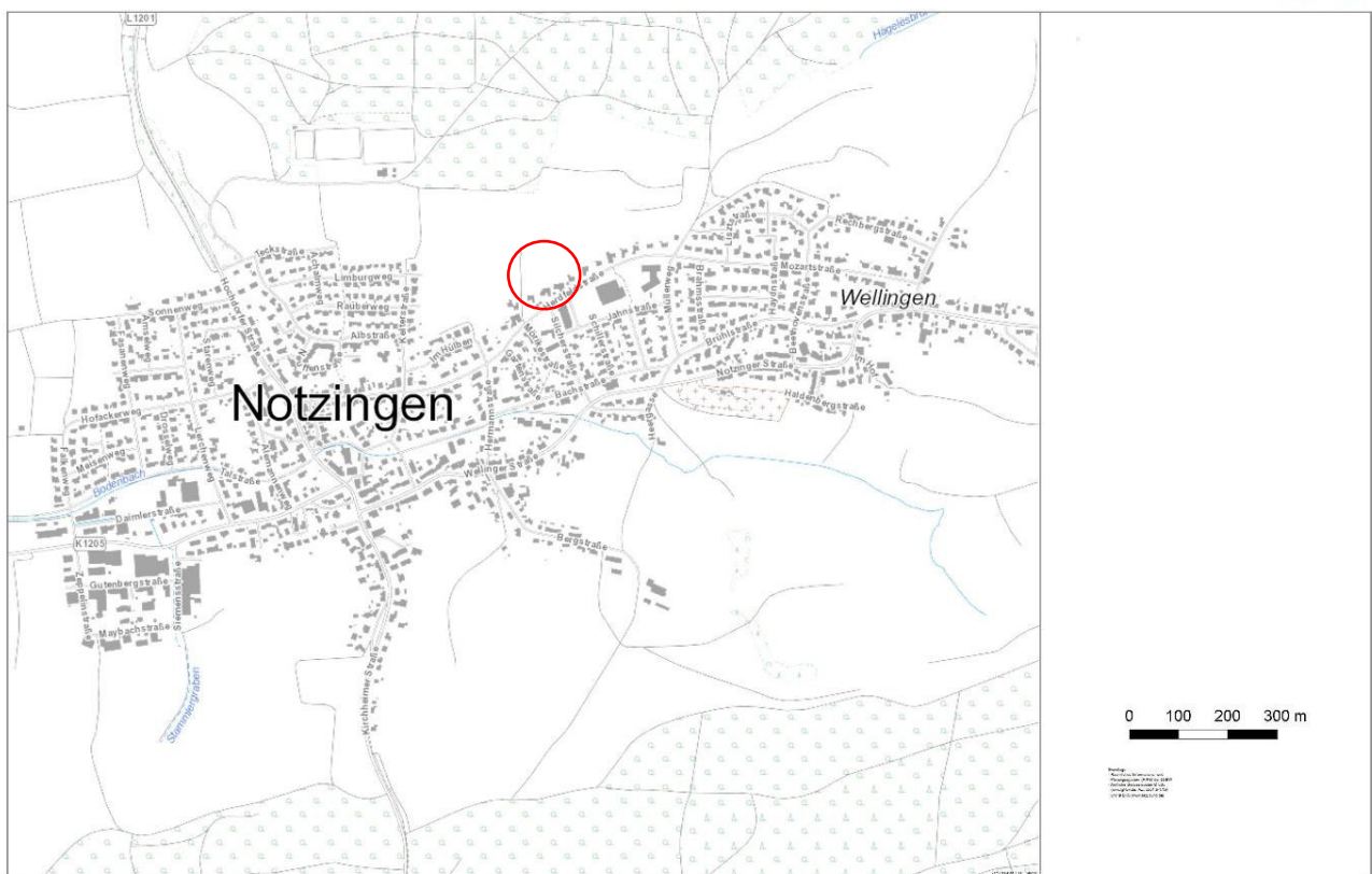
Abb. 1: Lage des Plangebiets (rot umrandet) im Raum (unmaßstäblich;)