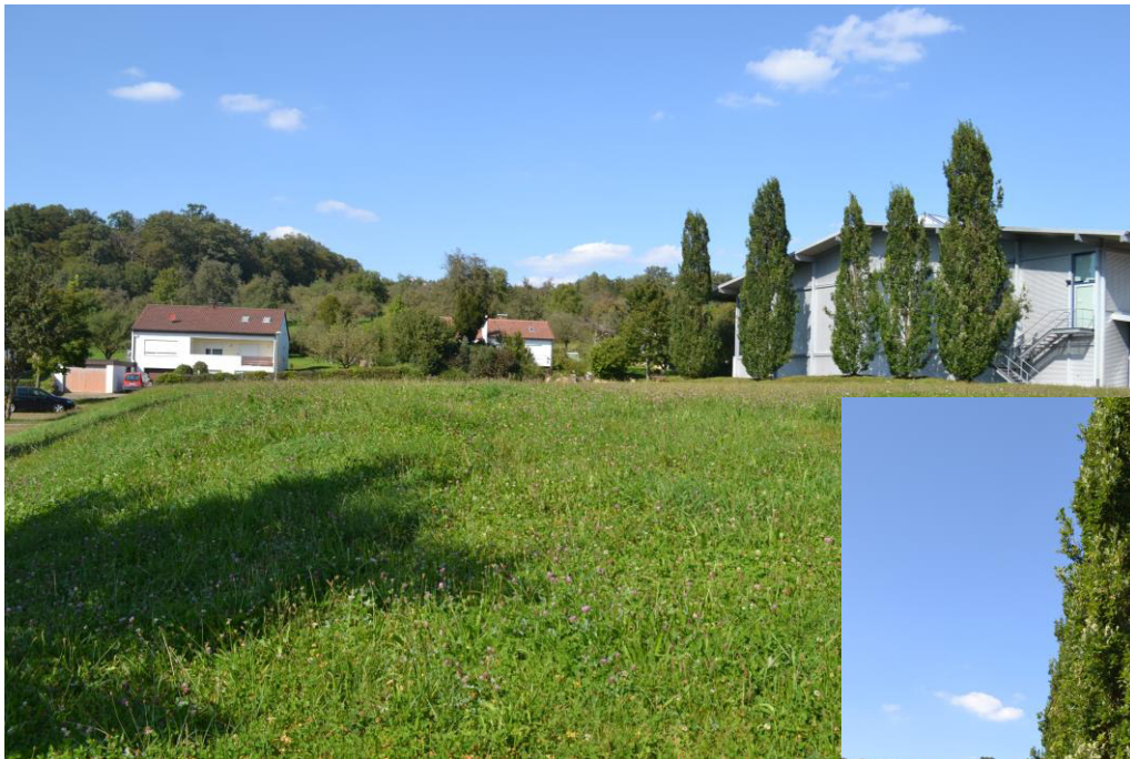
Abb. 3: Blick auf die Freifläche des Plangebiets (Fettwiese).