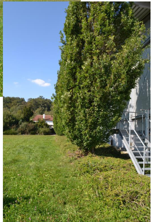
Abb. 4: Bestandsbäume im Osten der Fläche angrenzend an die Sporthalle.